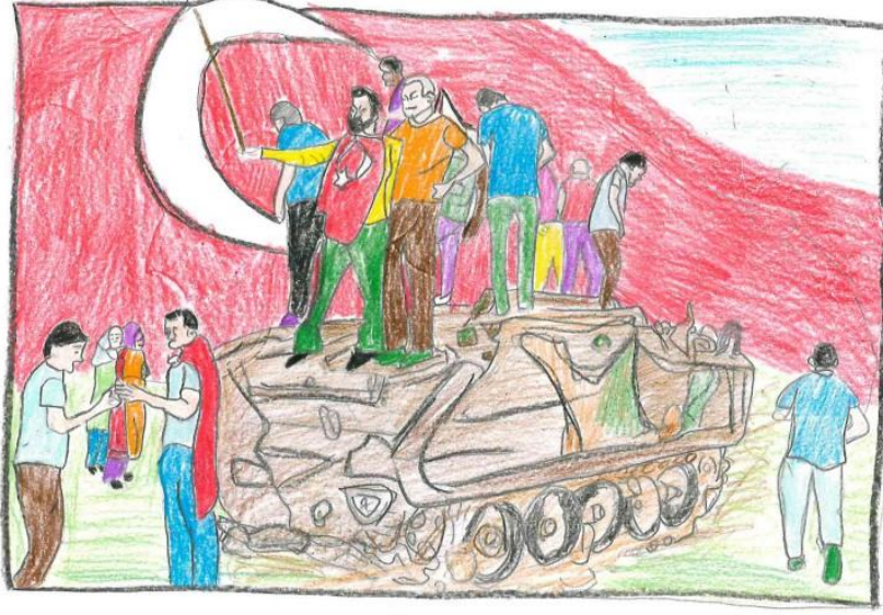
Gamze KORKMAZ 71B 12m