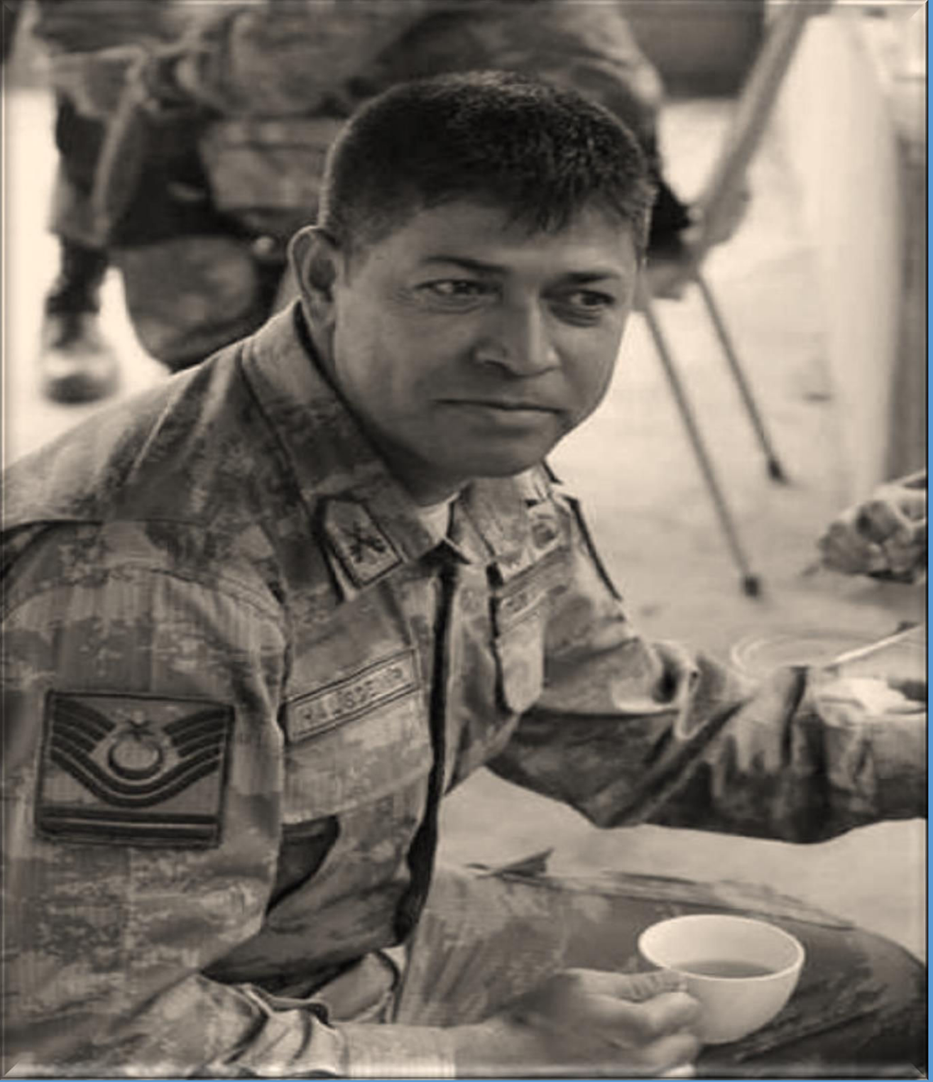
ŞEHİT ÖMER HALİSDEMİR

“Allah yolunda öldürülenlere «ölüler» demeyin. Bilakis onlar diridirler, lâkin siz anlayamazsınız.”